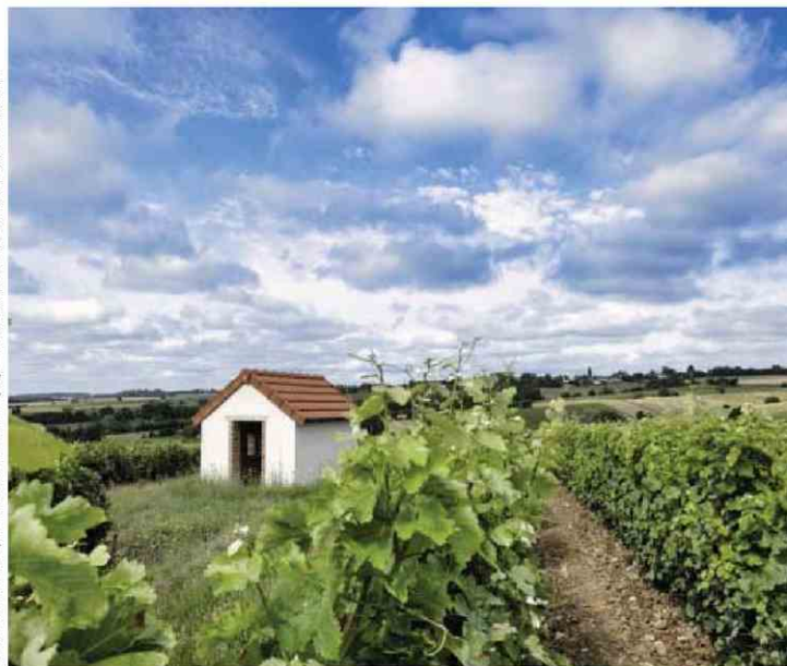
SEBASTIEN ORTOLA/REA POUR «LE POINT», (2) - ILLUSTRATION: DUSAULT POUR «LE POINT»

Philippe Gilbert a converti ses 30 hectares de vignes en bio.