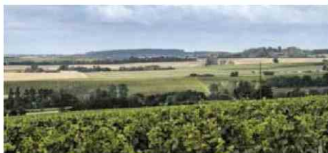
Les vins de Philippe Gilbert tirent leur spécificité des sols.

Menetou-Salon (18) 02.48.64.87.72. 14 - Des arômes de grillé, bouche vive, tendue, épicée, poivrée, amertume des agrumes en finale. 7,20 €.